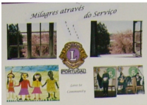
Cartaz concorrente do D115 CN 2008-09